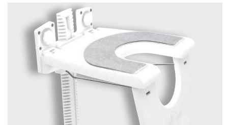
Duschklapsitz mit Antirutschauflage Art.-Nr. Seite 23