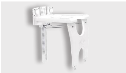
Duschklapsitz (varioporto) Wandmontage Art.-Nr. Seite 23