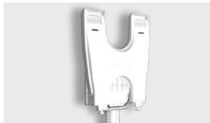
Duschklapsitz (varioporto), platzsparend klappbar Art.-Nr. Seite 23