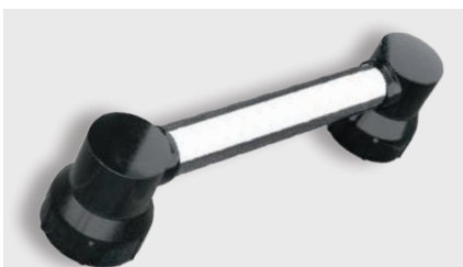
varioplus deluxe Träger · schwarz Griffrohr · 20cm/40cm verchromt · Art.-Nr. Seite 20+21