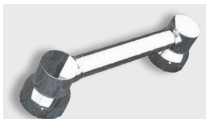
varioplus deluxe Träger · verchromt Griffrohr · 20cm/40cm verchromt · Art.-Nr. Seite 20+21