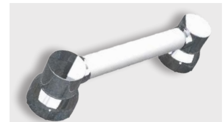
varioplus deluxe Träger · verchromt Griffrohr · 20cm/40cm weiß · Art.-Nr. Seite 20+21