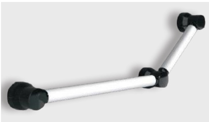
varioplus deluxe Gelenkgriff

Träger · schwarz Griffrohr · 75cm · weiß · Art.-Nr. Seite 20+21