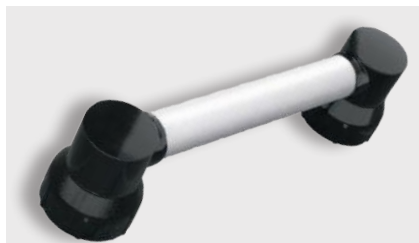
varioplus deluxe Träger · schwarz Griffrohr · 20cm/40cm weiß · Art.-Nr. Seite 20+21