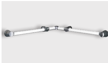
varioplus deluxe mit Eckverbinder

Träger · schwarz Griffrohr · 75cm · weiß · Art.-Nr. Seite 20+21